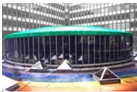
Laboratoire de Physique Nucléaire et de Hautes Énergies